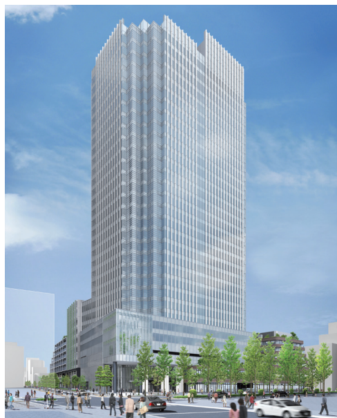
竣工イメージ (四ツ谷駅側より)